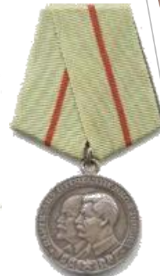
Медаль «Партизану Отечественной Войны 1 степени»