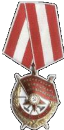
Орден Боевого Красного знамени