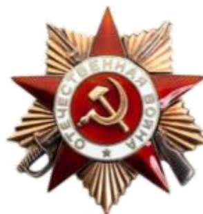
Орден Отечественной Войны 1 степени