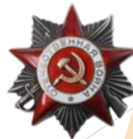
Орден Отечественной Войны 2 степени