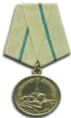
Медаль «За оборону Ленинграда»