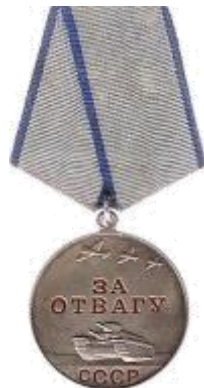
Медаль «За отвагу»