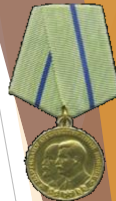
Медаль «Партизану Отечественной Войны 2 степени»