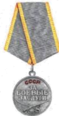
Медаль «За боевые заслуги»